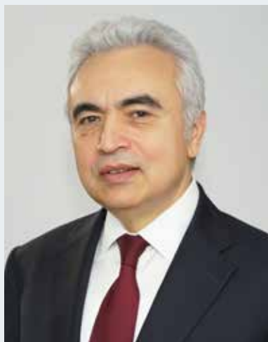
FATIH BIROL Directeur exécutif