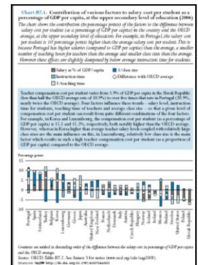
Graf B7.1 Míra vlivu různých faktorů na náklady na platy učitelů na vyšší sekundární úrovni přepočtené na jednoho žáka vyjádřené jako podíl na hrubém domácím produktu na hlavu (2004)

Naproti tomu mnoho evropských zemí nenavýšilo veřejné výdaje na vysoké školství do té míry, aby byla zachována předchozí úroveň výdajů na jednoho studenta, ani neumožnilo vysokým školám předepisovat školné. Důsledkem je, že jejich instituce mají stále větší potíže s rozpočtem, což může v konečném důsledku ohrozit kvalitu nabízených programů. Překvapivé je, že průměrné výdaje na jednoho studenta na terciárním vzdělávacím stupni jsou nyní ve většině evropských zemí výrazně pod polovinou průměrných výdajů ve Spojených státech. Přestože je volba mezi navýšením veřejných investic a zvýšením podílu soukromých prostředků obtížná, nedělat nic tváří v tvář zvyšující se poptávce po terciárním vzdělávání a jeho vyšší kvalitě se již nezdá být řešením.