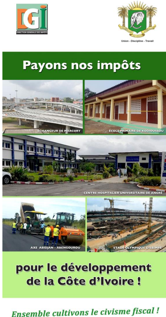
Gráfico 4.1. Costa de Marfil: Vinculación de impuestos y beneficios tangibles

BP V 103 Abidjan, République de Côte d'Ivoire Abidjan Plateau, cité administrative, tour E 800 88 888 (appel gratuit) Tél.: + 225 20 21 10 90 / 20 21 90 81 / 20 21 71 08 Fax : + 225 20 22 87 12 infodgi@dgi.gouv.ci