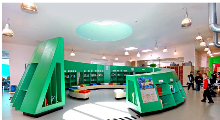
La « Maison du Livre »