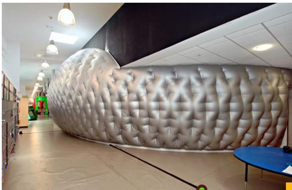
Le « Cerveau » vu depuis le couloir

Ce projet avait pour objet d'aller au-delà des fonctionnalités généralement escomptées d'une école primaire pour stimuler l'imagination des enfants. Il fallait donc remettre en question, dans une mesure raisonnable, chacun des paramètres qui sous-tendent, à l'heure actuelle, la conception des bâtiments scolaires pour définir ou réaffirmer les objectifs et vocations réels de l'école primaire. C'est ce qui a conduit l'équipe de projet à adopter le concept « d'architecture intelligente ».