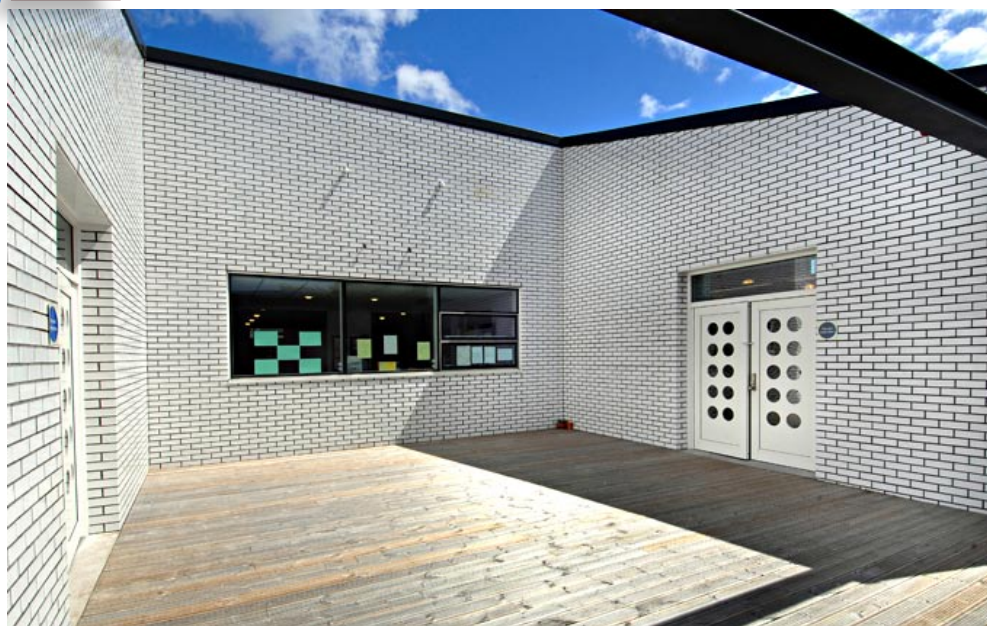
Les matériaux d'extérieur