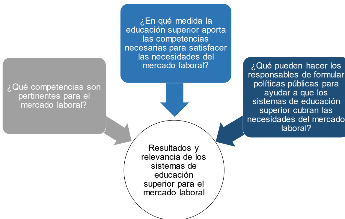
Gráfica 1. Análisis exhaustivo de los resultados y la relevancia de la educación superior para el mercado laboral: cuestionamientos clave

Con estas inquietudes en mente, la OCDE emprendió el análisis exhaustivo de los resultados y la relevancia de la educación superior para el mercado laboral, proyecto que tiene el propósito de ayudar a los países a mejorar estos mediante una mayor comprensión de los vínculos entre el conocimiento y las competencias desarrollados en la formación y los resultados obtenidos por los egresados, así como de la manera en que las políticas y las prácticas pueden estimular y potenciar el desarrollo de conocimientos y competencias más pertinentes para el mercado laboral. Tres cuestionamientos clave orientan el análisis para ayudar a los países a identificar lo que pueden hacer para garantizar que los egresados de educación superior desarrollen esas competencias requeridas (Gráfica 1).