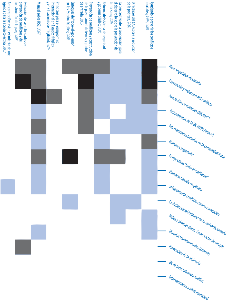
Gráfico 0.1. Orientaciones del CAD-OCDE: Carencias en la definición de políticas y programas