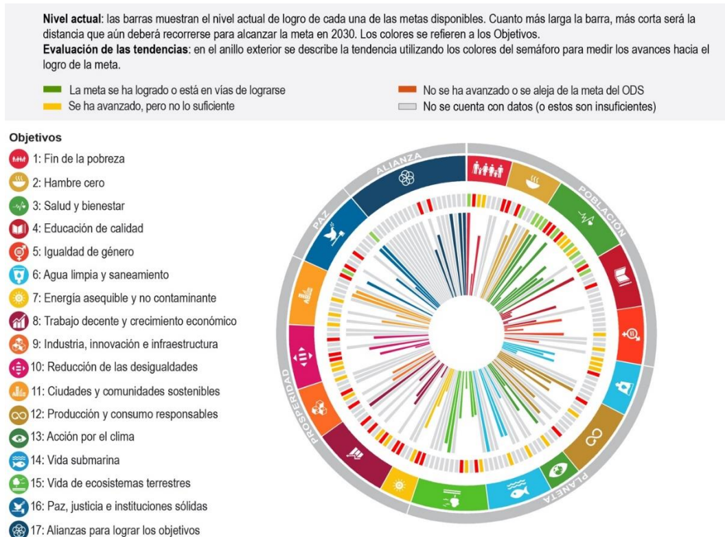
Gráfica 1. México: Distancia por recorrer para lograr las metas de los ODS incluidas en este informe